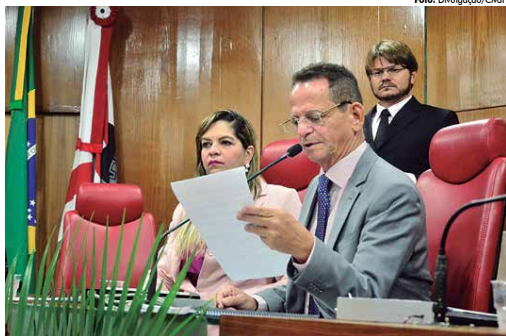
Gestor do SUS em audiência pública para apresentar relatório trimestral na Casa Legislativa