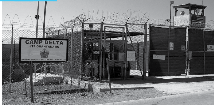
Prisão de Guantánamo, localizada na ilha de Cuba, tem recebido indignação na comunidade internacional, que defende a desativação