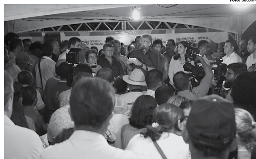
Ricardo recebeu investimentos de R$ 4,4 milhões e beneficiará mais de 23 mil habitantes de Gurinhém e Mulungu.

O presidente da Assembleia Legislativa da Paraíba, Gervásio Maia, falou sobre a satisfação de estar presen-