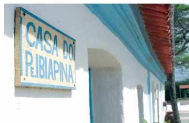
Casa onde morreu o cearense considerado o "Apóstolo do Nordeste"