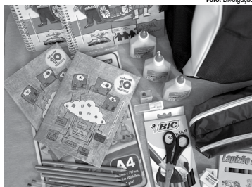
Kit escolar composto de acordo com a faixa etária dos estudantes