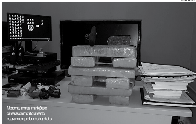
Maconha, armas munições e câmeras de monitoramento estavam em poder dos bandidos