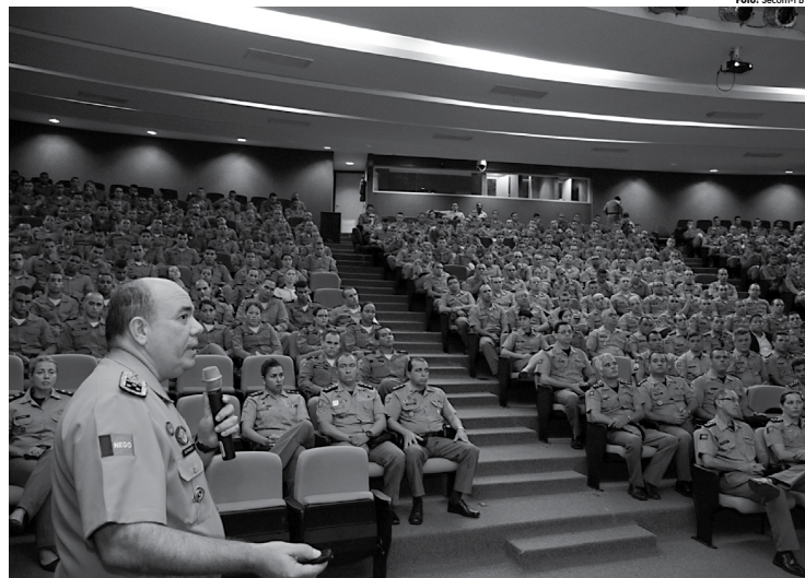
A abertura foi feita ontem durante aula inaugural, no auditório da Estação Cabo Branco - Ciência, Cultura e Artes, em João Pessoa

A aula inaugural foi realizada com o auditório lotado de policiais dos cursos de formação de oficiais, curso de habilitação de oficiais, curso de formação de sargentos e curso de formação de soldados, que prestigiaram a palestra do chefe da instituição e retomaram as atividades pedagógicas para o ano de 2017.