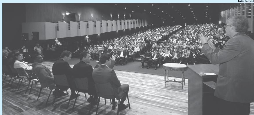
Ao lançar a ação 2017 do programa de capacitação de gestores de prefeituras, o governador Ricardo Coutinho (PSB), destacou que o ideal seria a adesão de todos os municípios do Estado.

Sanção acompanha também recomendação para que a Prefeitura adote medidas que melhorem a qualidade do padrão de obras